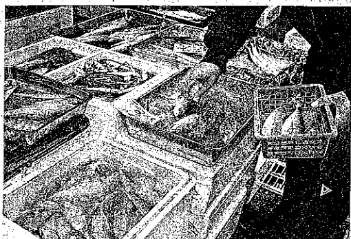
売り場には客足が戻りつつある(東京都江東区の豊洲市場にある水産仲卸)